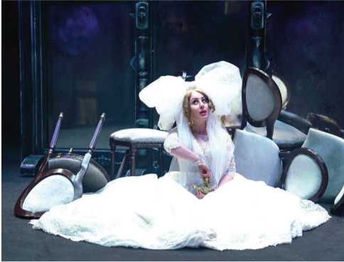
Персонажи Гоголя в этом спектакле погружены в трущобы-лабиринты Петербурга с его