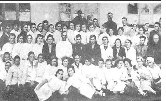
рировано на госпитальном деле. Уже в июле 1941 года в Дербенте

Интересы фронта требовали, чтобы главное внимание органов здравоохранения было сконцент-