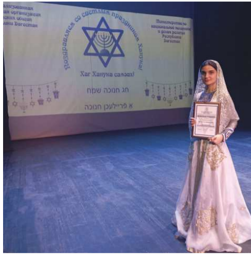
Поздравляем всю дружную команду театра!

Руководство театра и актеры, принимающие активное участие во всех проводимых общинной мероприятиях, были отмечены Почетными грамотами от Централизованной религиозной организации иудейских общин.